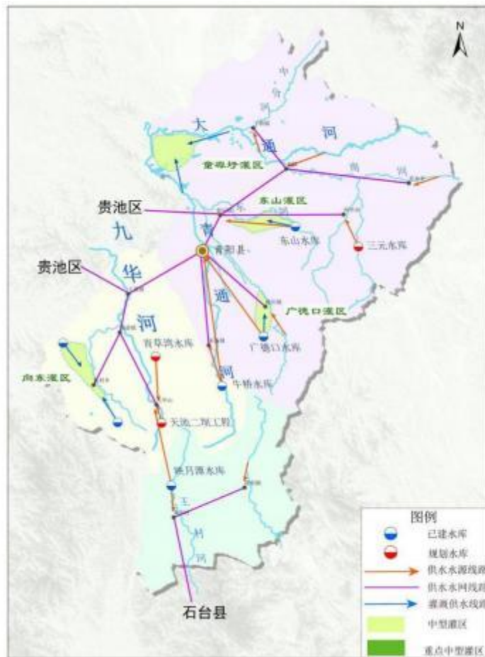
图 2.4-2 池州市现代水网青阳县水网格局图

本次规划从青阳县水网发展目标、保障要求出发，与《池州市现代水网规划》的布局相衔接，统筹考虑提高供水保障，洪涝灾害防御、生态保护与修复、水利智慧化管理，加强大通河、青通河、九华河系统治理和上游大水源建设，搭建以水库、输水干线为重点的水网骨架，构建“九结联动共调控，三千六支保安澜”的青阳现代水网总体布局，全面实现“青阳-九华”常备结合的双水源保障，生活优质水源保障，推进有条件地区分质供水。显著提升人居亲水空间品质，打造青阳安全水、生命水、幸福水。