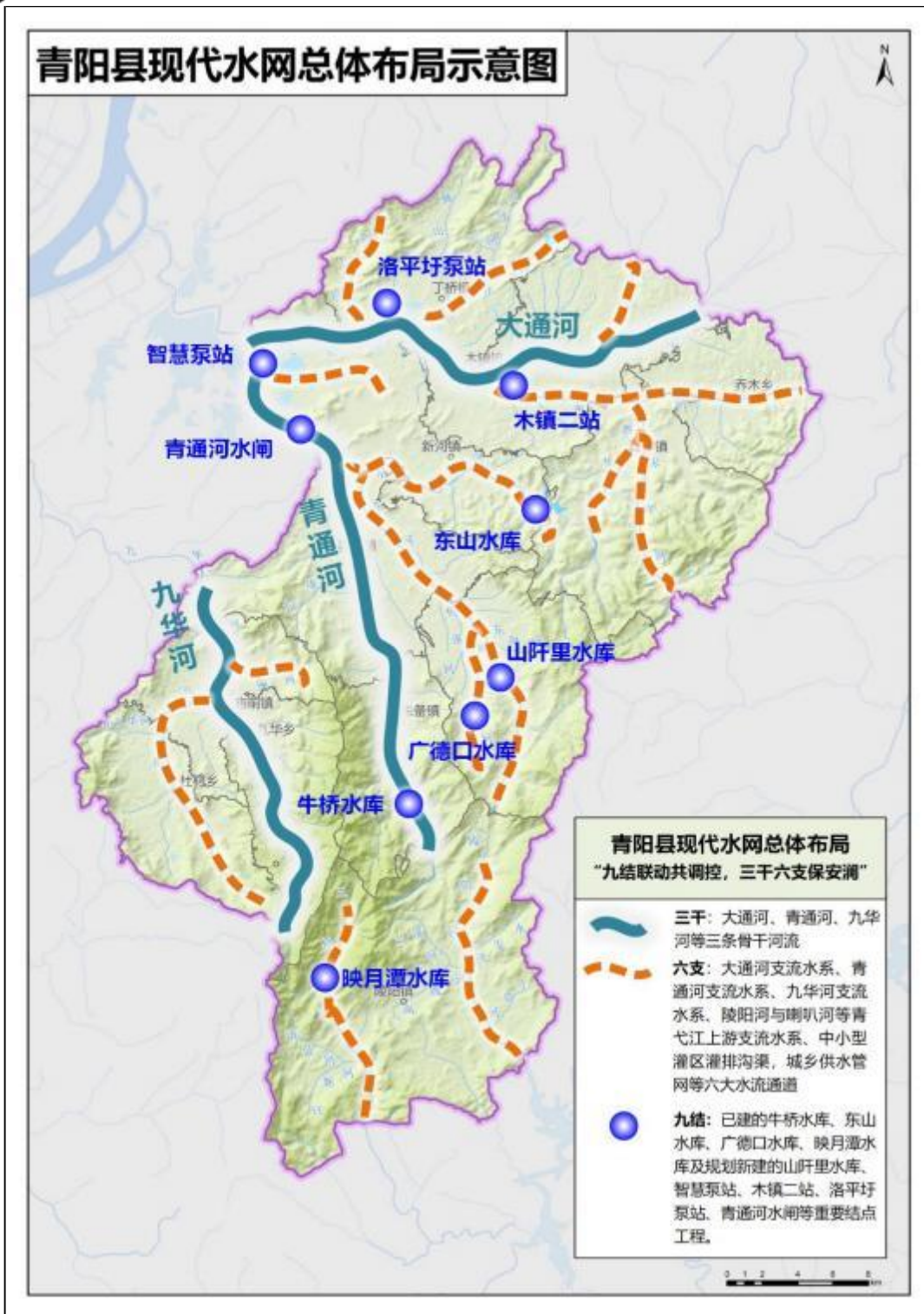
图 2.4-3 青阳县现代水网总体布局示意图