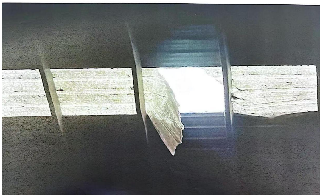
图3 2#厂房房顶透光板断裂细节图